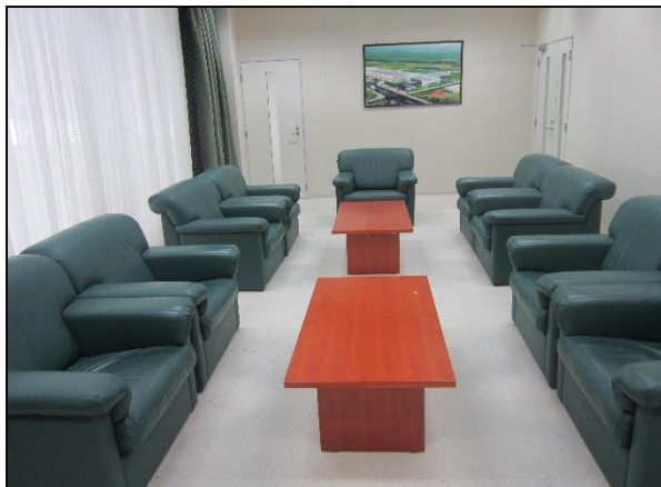
Phòng tiếp khách