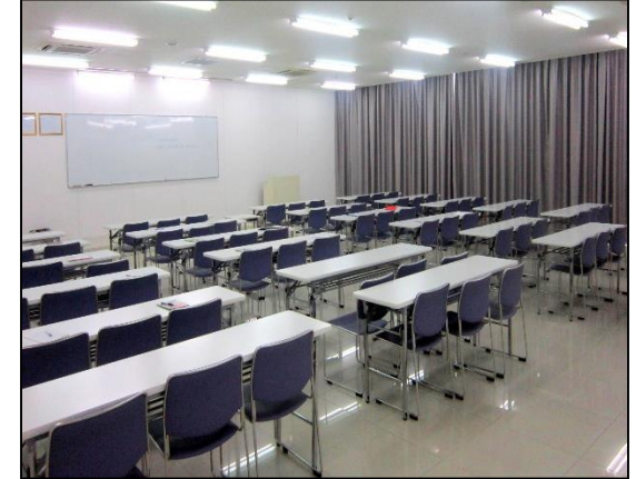
Phòng đào tạo