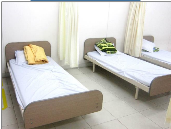
Phòng y tế