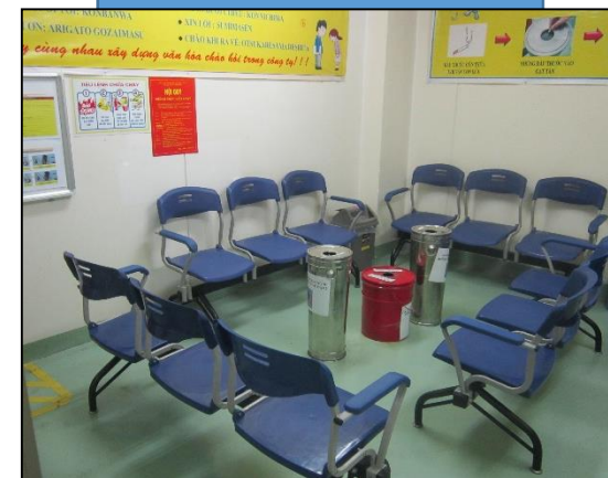
Phòng hút thuốc