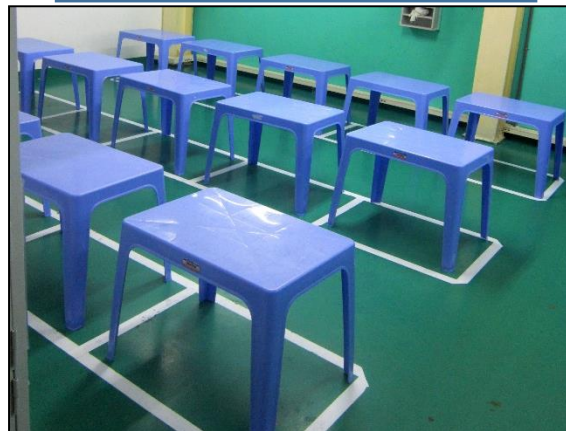
Khu vực nghỉ giải lao