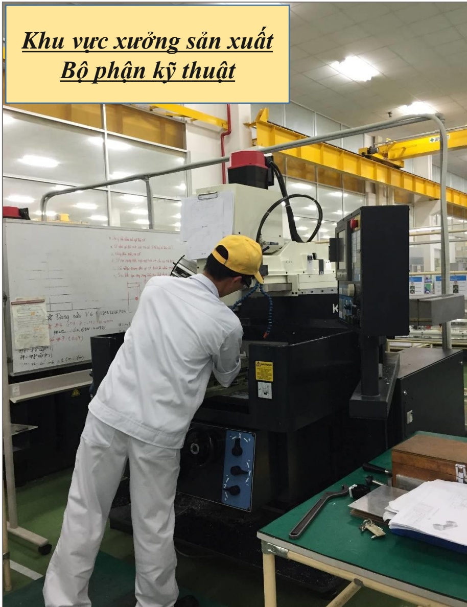
Khu vực xưởng sản xuất Bộ phận kỹ thuật